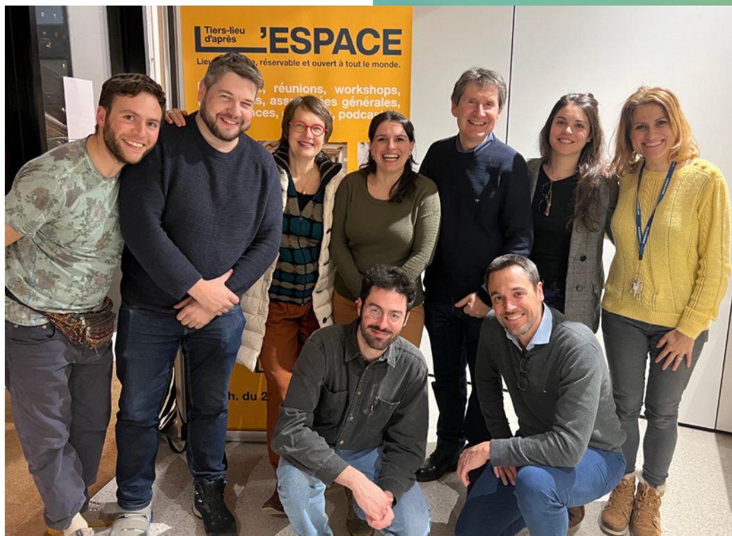
Soirée APRÈS, SENS et FSE

APRÈS participe activement aux réflexions et mises en œuvre du RTE à Genève, que ce soit au sein de la Coopérative meyrinoise COMÈTE ou dans le groupe de travail cantonal .