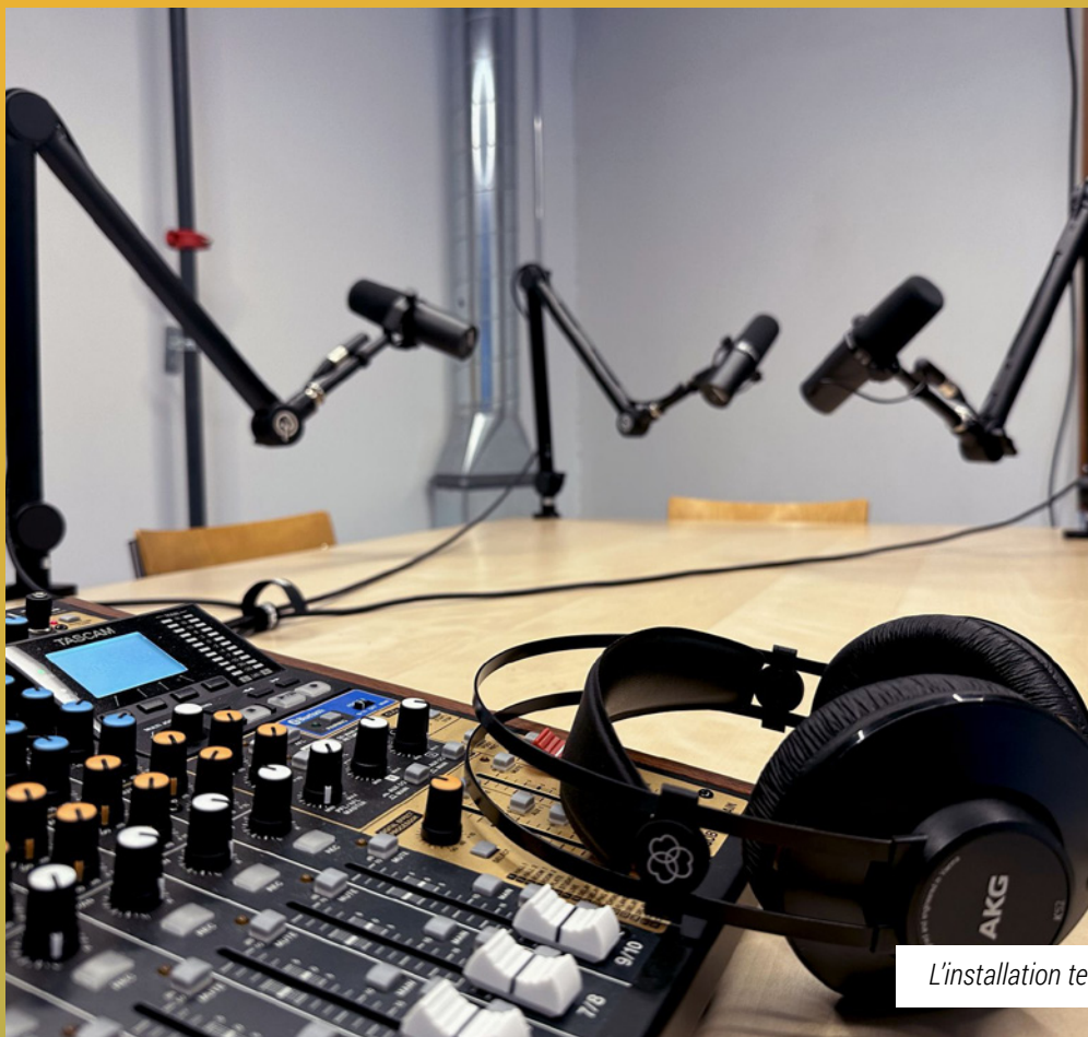
L'installation technique « podcast »