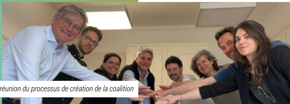
Une réunion du processus de création de la coalition

Une étude a été lancée pour permettre aux membres d'APRÈS et, plus généralement, aux entreprises de Suisse ainsi qu'à leurs partenaires financiers et commerciaux, de disposer d'un système de mesure (norme) lisible et facile à utiliser concernant leur contribution au respect des limites planétaires et à la recherche du bien commun, (1) qui donne à nos membres un accès prioritaire aux marchés publics et à la finance d'impact, sur la base de standards reconnus au niveau européen, (2) progressif, pour permettre à chaque entreprise de choisir son niveau de mesure, en fonction de sa taille, de ses moyens et de l'impact recherché : du processus d'adhésion à la labellisation. L'objectif est également de pouvoir améliorer le processus d'adhésion à APRÈS,