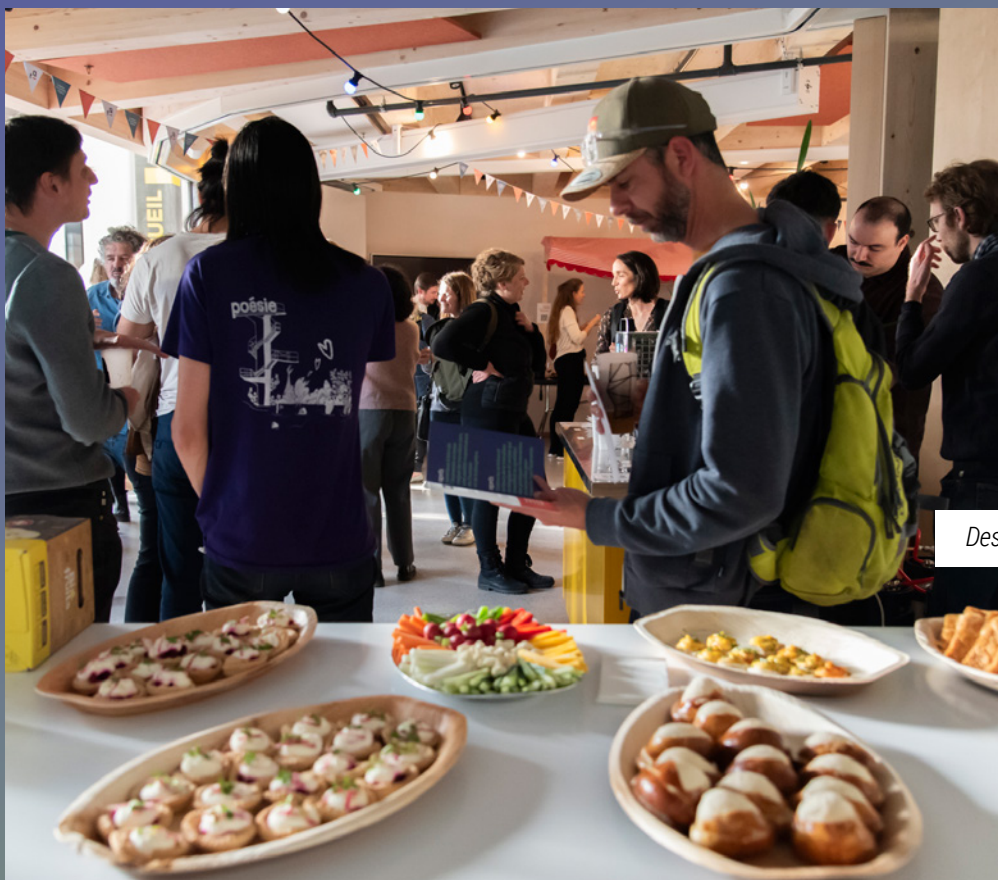
Des apéros des membres