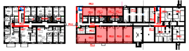
Plan de situation dans l'immeuble (rez inférieur 2)

Ateliers avec logement Ateliers sans logement