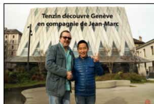
EXPOSITION PHOTOS PAGE 2