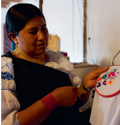
Equateur 2013