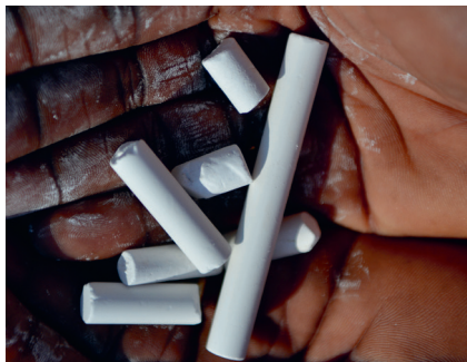
Destins en mains

Helvetas Genève présentera Destins en mains , une exposition du photographe suisse Jean-Pierre Grandjean sur les femmes et les hommes qui, de par le monde, travaillent de leurs mains pour améliorer leurs conditions de vie dans les pays en développement.